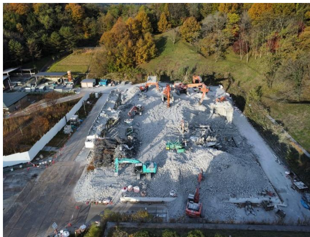
11 月中旬（東側上空からの写真）